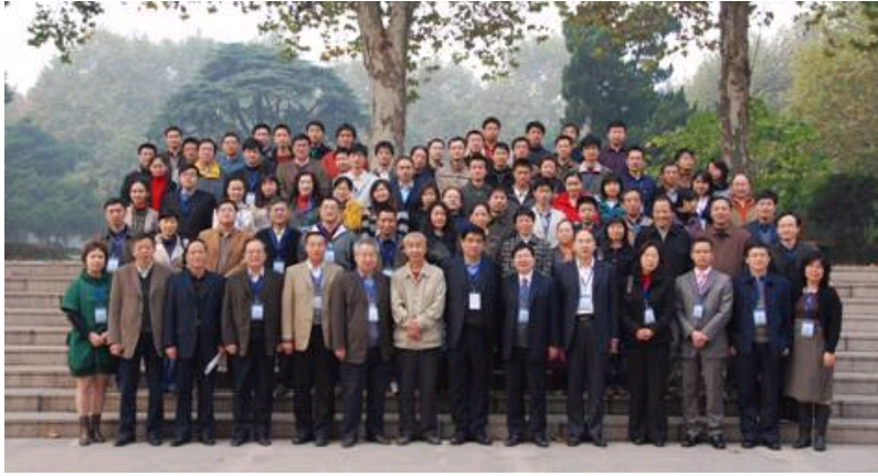
“中国当代科学口述历史学术研讨会” 与会代表合影