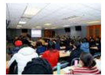
“深入学习贯彻党的十九大精神 加快推进中国特