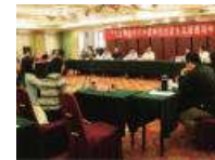
新时代社科理论界的担当与责任