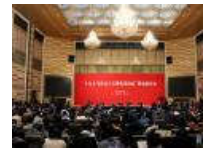
北京大学召开“十九大与社会主义现代化国家”理