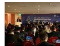
清华大学举办“一带一路达沃斯论坛”共话“新型”