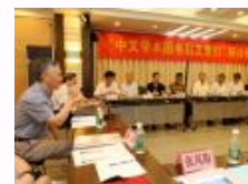
“中文学术图书引文索引” 研讨会在南大举行