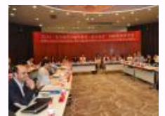
“重访城市”国际研讨会在 上海交大举行