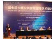
第七届中美公共管理国际学 术研讨会在人民大学召