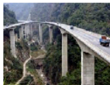
公路贵州盐津河段