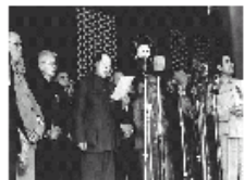
毛泽东开国大典讲话