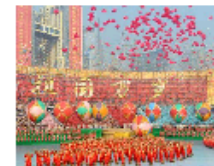
广西壮族自治区50周年