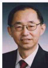
我们应当怎样看待新中国的两个30年