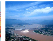
长江三峡大坝全景