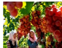
无公害葡萄获得丰收