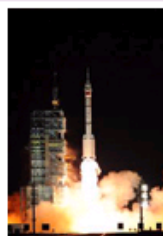
长征二号运载火箭点火