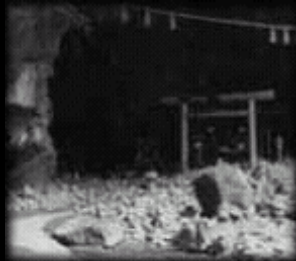
天之岩屋 天岩戶神社 仰慕窟

堪忍袋 緒 天照大御神 天石屋戶 籠 天地 真 暗闇 太陽神 天照大御神 隱 禍 湧 出 暗闇 中