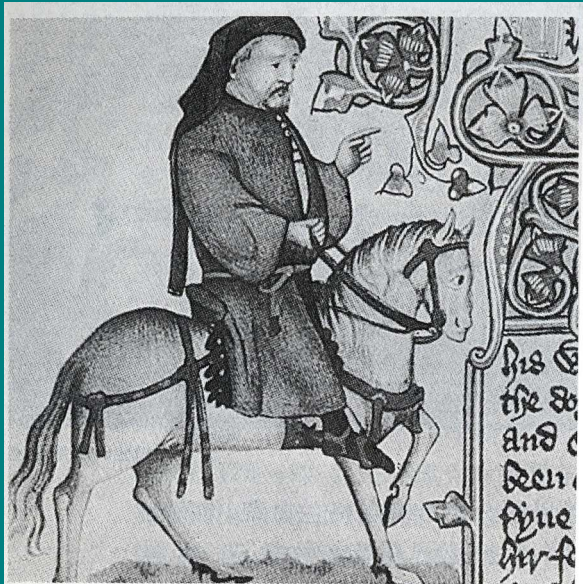
杰弗里·乔叟 (1340 - 1400年)