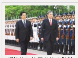
胡锦涛与德国总统克勒举行会谈