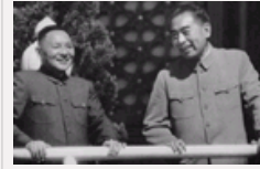
周恩来: 用生命的最后力量 力荐邓小平接班