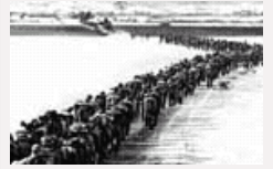
再论有关抗美援朝以讹传讹的那几件事