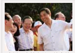
中国“个性官员”越来越多