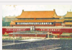
毛泽东逝世33周年 一生不负凌云志