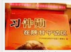
《习仲勋在陕甘宁边区》 首发 陆浩作序