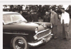
“红旗”车阅兵历程 林彪第一个乘坐检阅部队