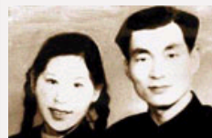
【组图】朱镕基风采魅力照