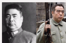
铁骨柔情——传奇爱国将军冯玉祥的绝版亲情照