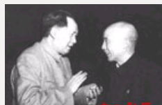
最早发现毛泽东有雄才伟略的人是誰