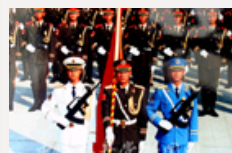
1999年建国五十周年国庆大阅兵