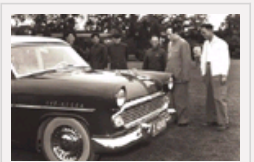
“红旗”车阅兵历程 林彪第一个乘坐检阅部队