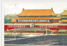
毛泽东逝世33周年 一生不负凌云志