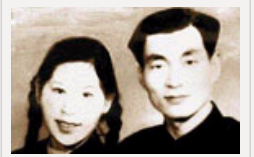
【组图】朱镕基风采魅力照