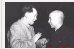
最早发现毛泽东有雄才伟略的人是谁