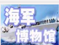
网上海军博物馆推出