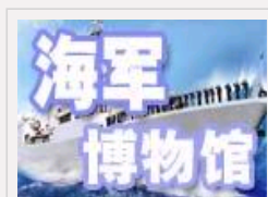
网上海军博物馆推出