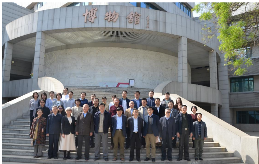
图 7 与会人员合影

本次开题报告会上，还展出了目前已修复整理的部分馆藏和田文书，课题组成员、专家组围绕修复、保存、展览等环节，进行了热烈的讨论，促进了关于和田文书整理研究的多维度交流，开阔了研究视野，提供了更多研究思路，为“中国人民大学藏唐代西域出土文献整理与研究”的进一步深入开展，奠定了基础。