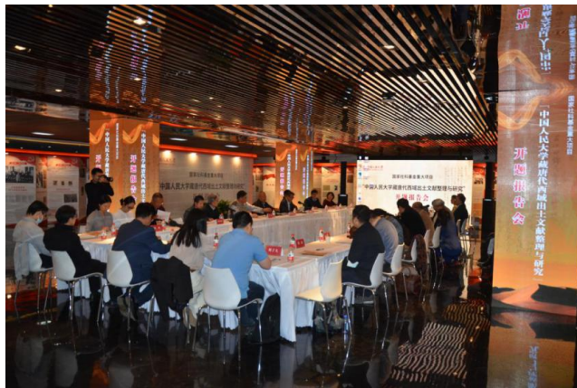
图 1 开题会会场

2021年4月19日下午，中国人民大学历史学院孟宪实教授主持的国家社科基金重大项目“中国人民大学藏唐代西域出土文献整理与研究”开题报告会在中国人民大学博物馆举办。中国人民大学副校长刘元春教授、科研处及院系有关领导领导出席会议并讲话。