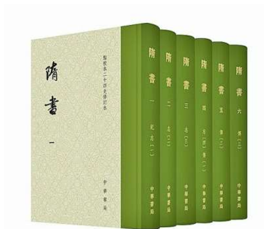
点校本《隋书》修订本。资料图片

国家图书馆藏文津阁《四库全书》。《隋书》确立的经、史、子、集四部分类法，影响深远。资料图片