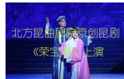
原创昆剧《荣宝斋》北京首演 荣宝斋故事搬上戏...