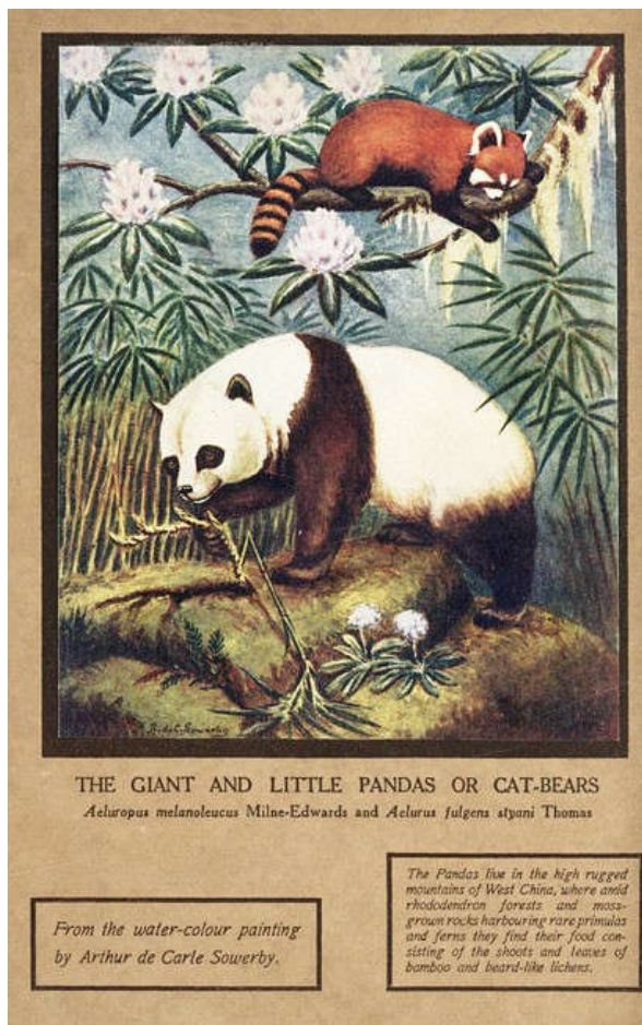
图片说明：《中国杂志》插图。

最早报道“北京猿人”、引发全球对大熊猫保护的关注、爱因斯坦《相对论》发表后跟进发布……1923年1月创刊于上海的英文汉学期刊《中国杂志》（China Journal），被学界形容为“包罗万象的人文和自然资料宝库”，90多年后，基于上海图书馆徐家汇藏书楼所藏《中国杂志》影印本由上海科学技术文献出版社出版。日前，《中国杂志》出版座谈会在上图举行，与会专家谈到，这次出版的整套38册《中国杂志》影印本，卷帙庞大，与以往乃至同期汉学杂志较多关注中国的历史、宗教不同，《中国杂志》刊登了大量自然科学和应用科学等方面的研究文章，几乎涵盖了中国的方方面面，从中可见，现代科学技术的发展，为20世纪汉学研究注入了新活力，这也使得该刊成为一份真正意义上的综合性汉学期刊。