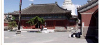
国家级—修缮后白塔寺