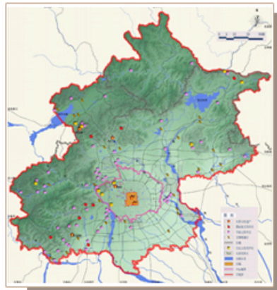
北京旧城文物保护单位及历史文化保护区规划图

统计数据包含分布在皇城内的故宫、景山、北海、中南海、社稷坛、太庙等文物保护单位。不含皇城内第一批14片历史文化保护区。