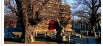
国家级—古树掩映的金刚宝座