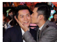
跑男亲脸表情四射