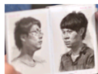
追梦路上的艺考生