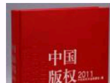
《中国版权年鉴2011》正式出版发行