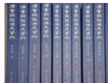
《〈清实录〉经济史资料(从顺治到嘉庆)》正式