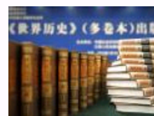
《世界历史》(多卷本)首发 使世界史研究体现