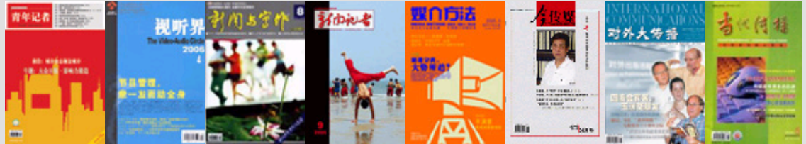
青年记者 视听界 新闻与写作 新闻记者 媒介方法 今传媒 对外大传播 当代传播