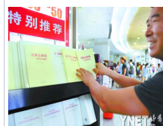
群众路线图书密集出版市 群众路线图书密集出版市