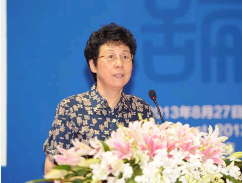
全国人大常委会副委员长、中国民主促进会中央委员会主席严隽琪

严隽琪指出，以数字技术、信息网络技术为代表的技术革命正在改变和重塑出版业，形成了新的全媒体发展格局。将文字、图片、声音、影像等元素运用有线互联网和无线通讯网等多种媒介，全天候、多方位、立体化地在手机、电脑、电视、移动阅读器等终端展示传播，已经成为世界出版行业的发展趋势。当下，只有合理统筹图书、报刊、电视、互联网、移动客户端等多种媒体资源，加快与新兴媒体的融合，开拓思路，创新模式，才能将传统出版业做大做强。