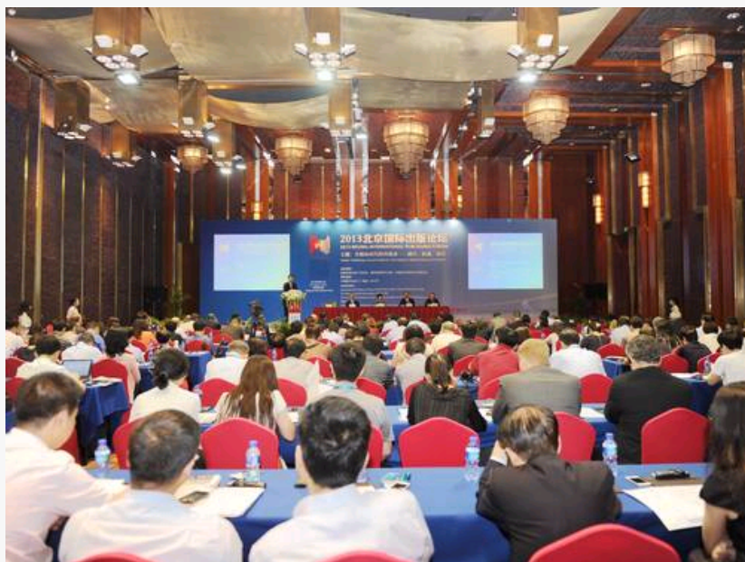
2013北京国际出版论坛在京举行

中国出版网讯 8月27日,由国家新闻出版广电总局、国务院新闻办公室和中国民主促进会中央委员会联合主办,中国图书进出口(集团)总公司承办的2013北京国际出版论坛在京举行。本届论坛的主题是“全媒体时代出版业:融合、机遇、前景”。全国人大常委会副委员长、中国民主促进会中央委员会主席严隽琪出席并致辞,国家新闻出版广电总局副局长邬书林,国务院新闻办公室副主任李伍峰发表主旨演讲。国家新闻出版广电总局进口管理司司长张福海主持论坛开幕式。