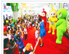
第五届东莞漫博会22日开幕