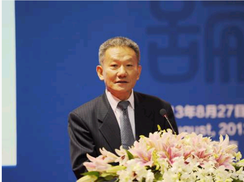
国家新闻出版广电总局副局长邬书林

邬书林指出，在政府的积极推动下，中国新闻出版业与科技融合取得了积极进展。在过去的一年里，中国新闻出版业与科技融合的进程在不断发展：传统新闻出版单位的数字化转型日趋深入，新媒体企业在数字出版业务方面取得新突破，数字内容投送平台多样化趋势日渐明显，数字出版标准体系建设日渐完善，数字出版产业呈现出快速发展态势。