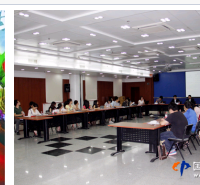
第二十届北京国际图书会召开第二次...