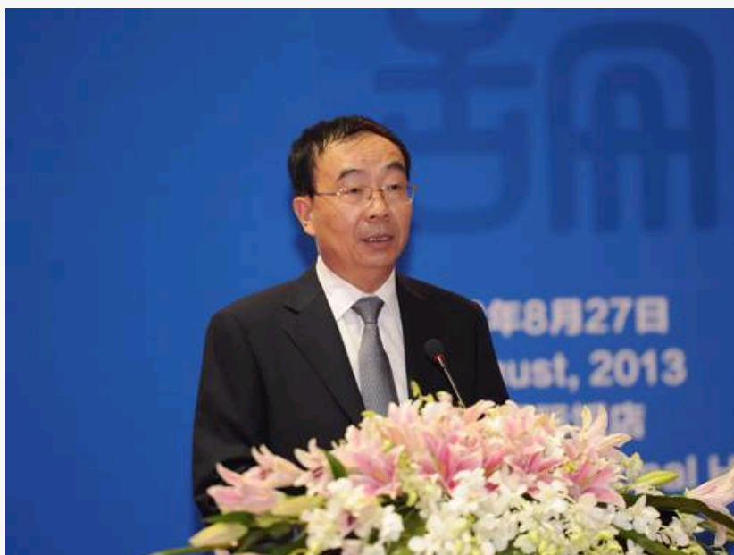
国务院新闻办公室副主任李伍峰

邬书林强调，学习借鉴国外同行经验、加快新闻出版与科技融合、提高新闻出版的科技含量，是中国新闻出版业今后发展的重点。他表示，中国政府将继续加大对新闻出版与科技融合的支持力度，继续支持新闻出版行业的创新，继续推动传统新闻出版单位的转型升级，继续鼓励新闻出版企业与技术企业开展合作，继续加强中外数字出版领域的交流合作。