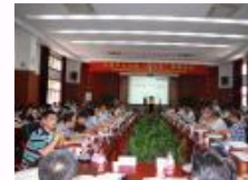
中国学术出版“走出去”高端论坛在上海交大出版