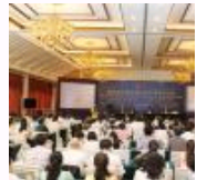
第四届证据理论与科