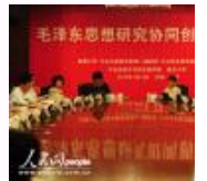
“毛泽东思想研究协同创新”研讨会在京举