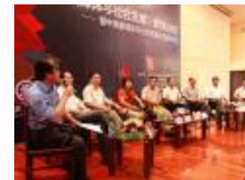
高校及传媒界专家齐聚交大共议“新媒体与社会发