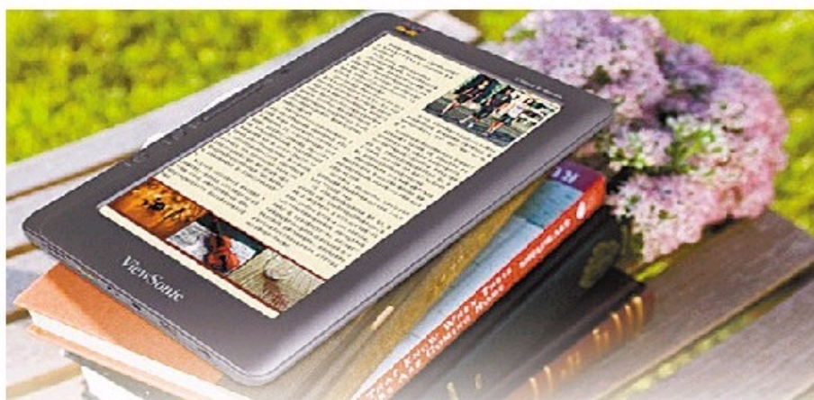
■电子书越来越受欢迎。 资料图片

【核心提示】 当虚拟审美及虚拟审美心理被整个社会普遍接受时,即完成了整个社会对于网络出版虚拟审美的接纳。网络出版虚拟审美的论题成立,标志着网络出版产业形态的成熟。