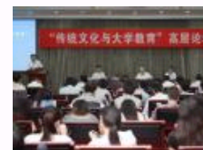
南开宣言:呼唤大学文化教育的“精彩配合”