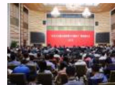
北京大学召开“社会主义核心价值观念与立德树人”