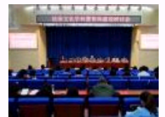
法治文化学科暨智库建设研讨会召开