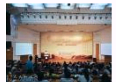
核心价值观百场讲坛在人民大学首讲 实现“中国