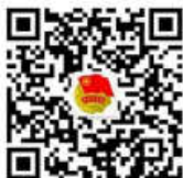
艺术学院团委微信