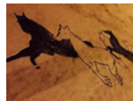
自悟雪地刻八骏图