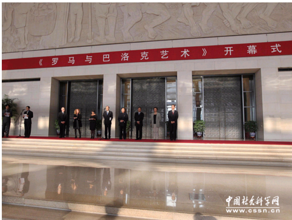
展览开幕式现场，中意双方相关领导、嘉宾出席并致辞。

中国社会科学网讯（记者吕家佐 杨崇海）4月29日，由中国国家博物馆、意大利文化遗产活动和旅游部文化遗产开发司、罗马历史、艺术、民族人类遗产及博物馆联盟特署联合举办的“罗马与巴洛克艺术”展在国家博物馆隆重开幕。