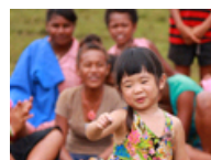
爸爸去哪儿大电影