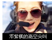
邓紫棋的高空尖叫