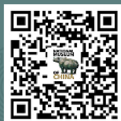
国家博物馆英文版 微信服务号