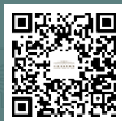
国博君 微信订阅号