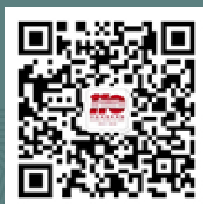
国家博物馆 微信服务号