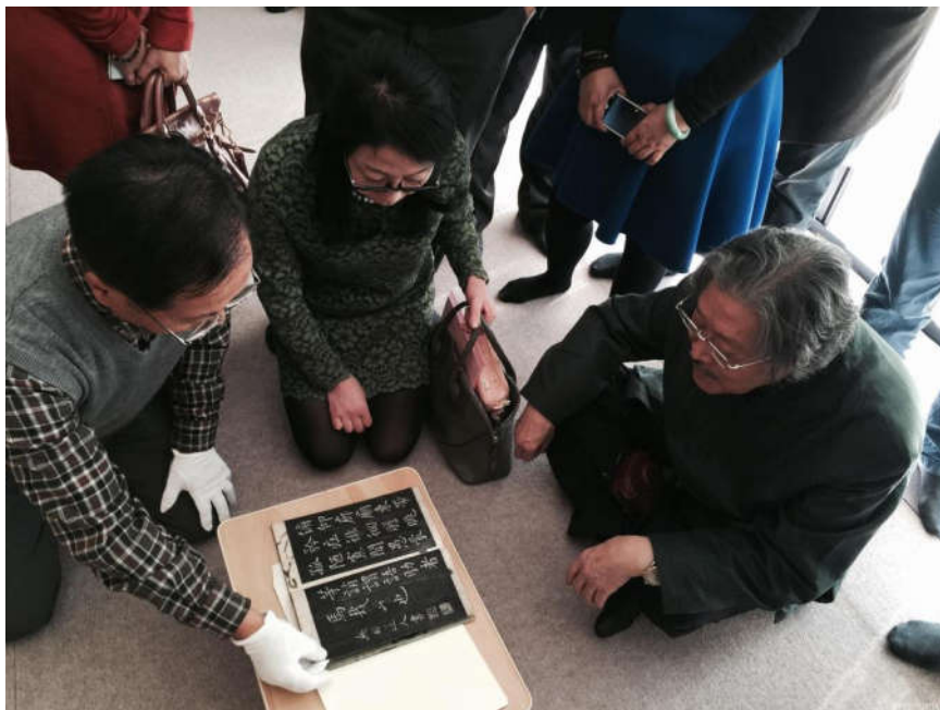
钟明善教授在野田神社鉴赏古代碑帖

在日本的一周，天朗气清，虽已进入冬季，但晴朗的空气中却充满着暖意，钟明善教授一行马不停蹄地辗转在各个活动现场，热烈的活动场景恰与明媚温暖的天气正相一致。在依依惜别之际，萱原晋社长感慨地说：“在20世纪影响日本书道界最大的中国书法家以前是于右任先生，现在是钟明善先生。”