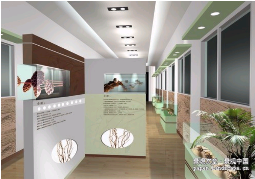
火车车厢内部结构