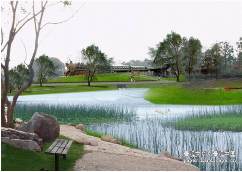
江苏常熟宝岩生态公园火车头项目