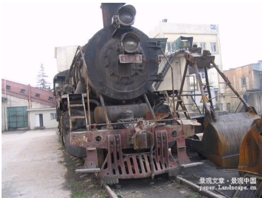
机车整修前的实际状态