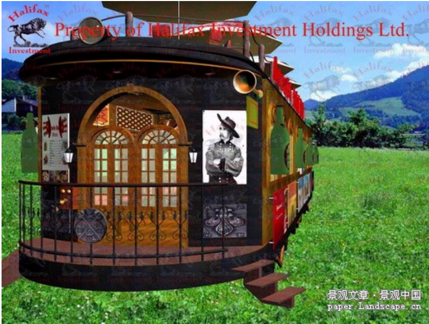
具有艺术感的酒吧火车厢外型