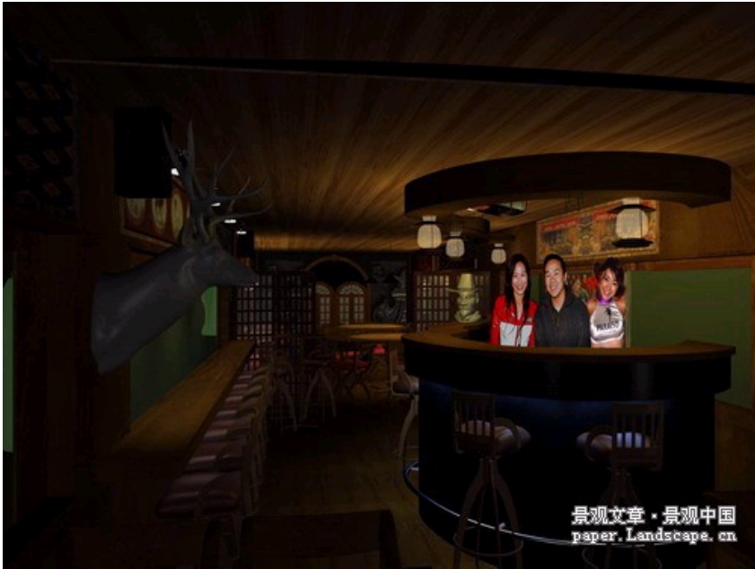
火车酒吧内部结构