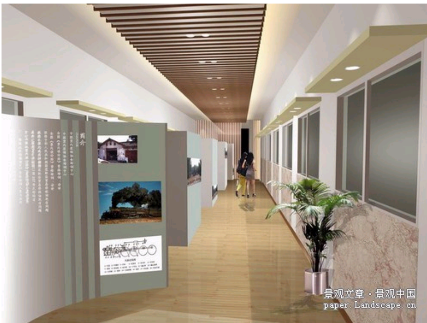
火车车厢内部结构