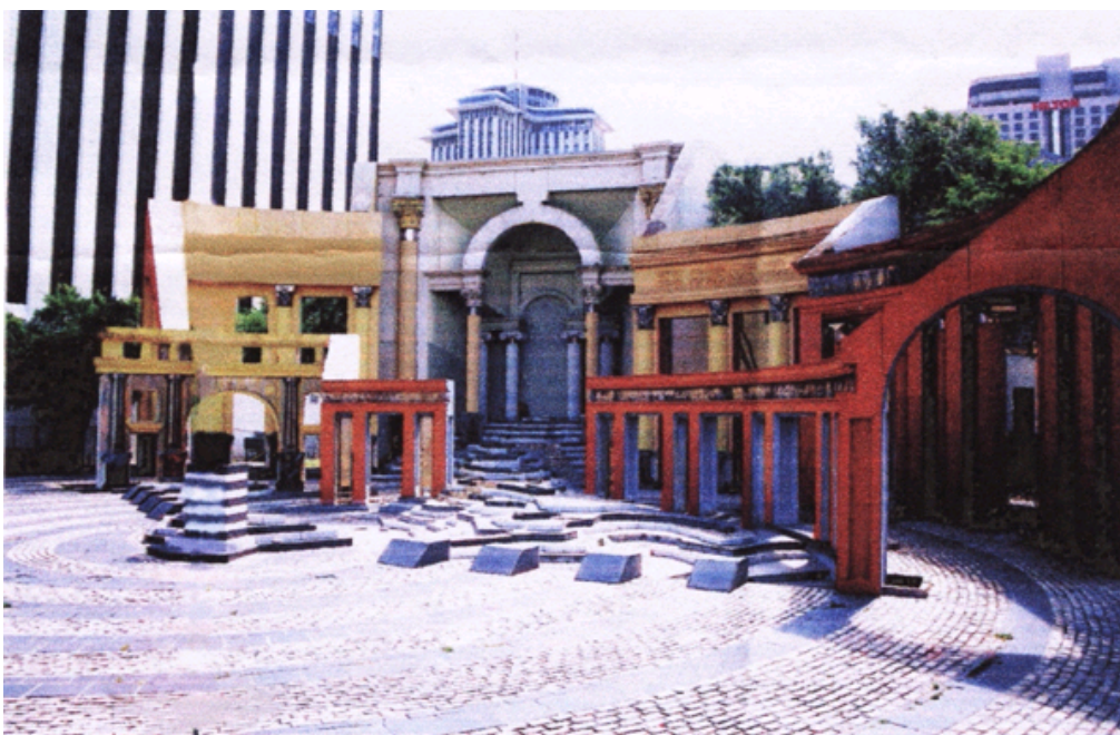
图五：新奥尔良意大利广场效果图（引自《城市景观设计》）

这是意大利的新奥尔良的意大利广场（如图三），这又是一个经典的而又与众不同的设计。设计师穆尔是通过暗喻的设计手法对历史符号的变形移植和拼贴而形成了这么一种多元性的广场。广场中央是意大利版图的轮廓（如图四），广场一侧设置了一组台阶式大型喷泉，背景是一大拱泉水从象征着阿尔卑斯山的台阶流下，注入到第勒尼安海和亚得里亚海，最后汇入广场中央的“地中海”，在“海”的中心设置了一个“西西里岛”（如图五）。它隐喻着意大利移民与这个岛的文脉关系。