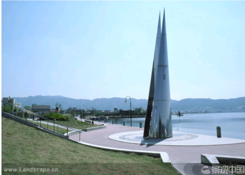
SUWA 滨水公园 (From 《YOSHIKI TODA LANDSCAPE and ARCHITECT》, JAPAN)