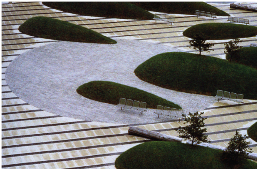
图二 明尼阿波利斯市联邦法院广场局部效果图（引自《建筑环境设计》）

这是一明尼阿波利斯市联邦法院广场[5]（如图一）的设计，在本设计中，设计师利用的景观元素并不多，但效果却很好，其中最引人注目的部分是一组铺着草坪的土丘，它们呈东西向排列，上面种着明尼苏达州森林里最常见到的土生土长的小型针叶树（如图二）。这些土丘象征着冰川运动地带所遗留下的起伏的地势，同时，用大树干当座椅，由此来象征明尼苏达州由来已久的支柱工业——伐木业。