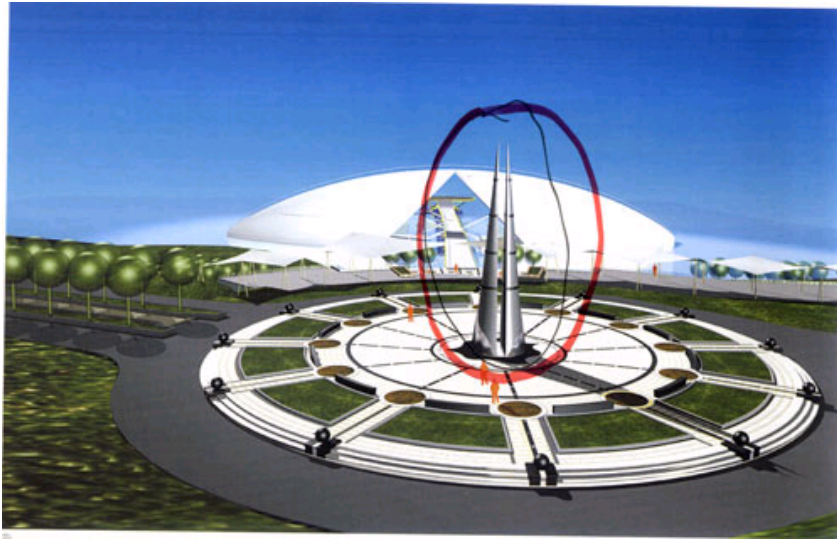
国外某知名设计公司在中国本土某公园的设计效果图

在设计SUWA 滨水公园时，由于该公园所在地区有个很出名的庙宇，庙里有四根特别有意思的木头柱子，所以户田先生就把该种形式用于公园两个铝合金柱子雕塑的设计中，这就是一种隐喻手法。