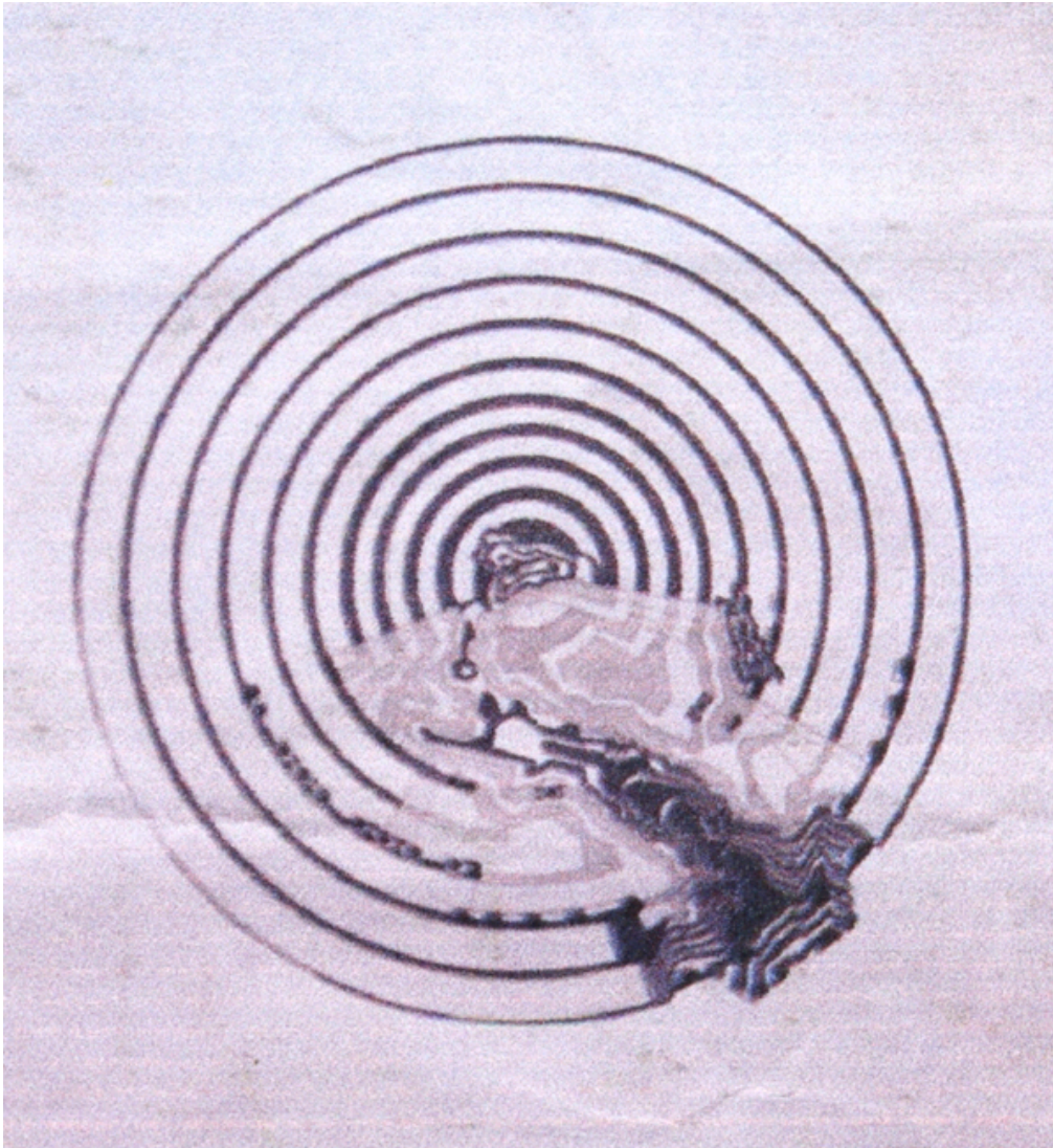
图四：新奥尔良意大利广场平面图（引自《城市景观设计》）