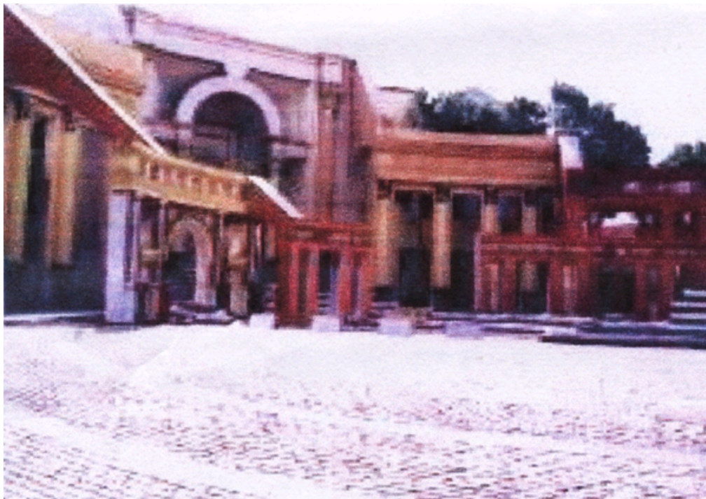
图三： 景观的文化语境—新奥尔良意大利广场（引自《城市景观设计》）