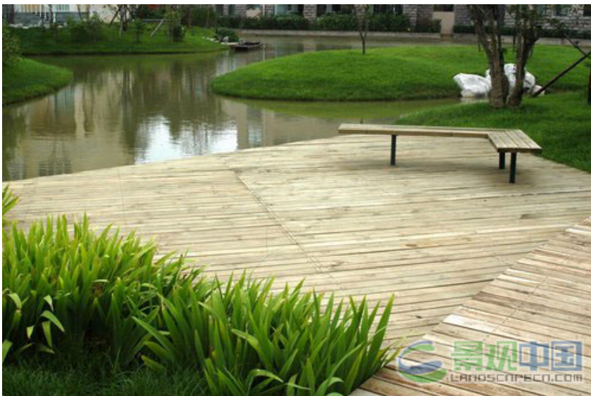
图10-12延伸入住宅后花园的溪流