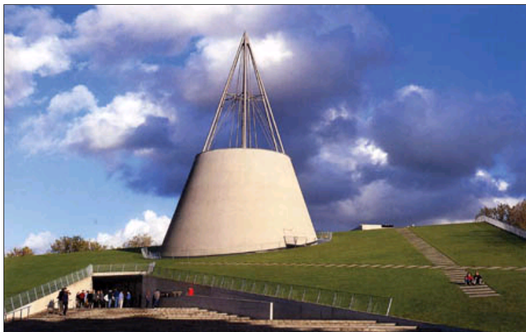
图1 代尔夫特工业大学新图书馆

由于土地的高度使用，激发了很多设计师的思考：为什么公园不能在垂直方向上发展？为什么不能克服重力的限制？自然为什么一定要依附于土地？这多是一种研究性的项目，最后实施得很少。MVRDV曾经设计过一个有29户的公寓，每一户都有一个阳台作为悬浮花园的形式。所以，当植物长大的时候，建筑结构就会隐藏在高40 m的森林中（图3）。