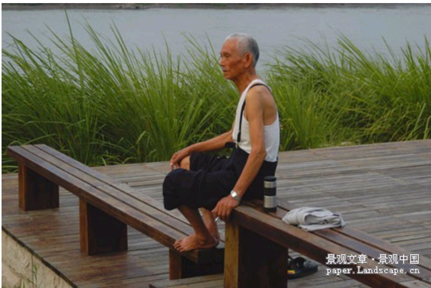
图-9, 10, 11, 12, 13

The banks of the Yongning River in Taizhou were renaturalized in connection with the design of the River Park, creating additional flood plains (page 75).