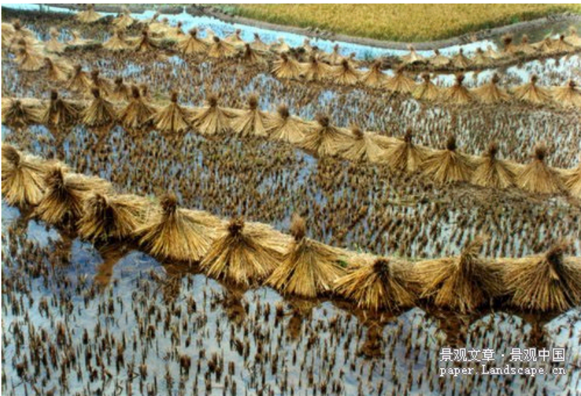
图-1,2 The diverse cultural landscapes in China such as the numerous rice terraces are the result of centuries-long cultivation.