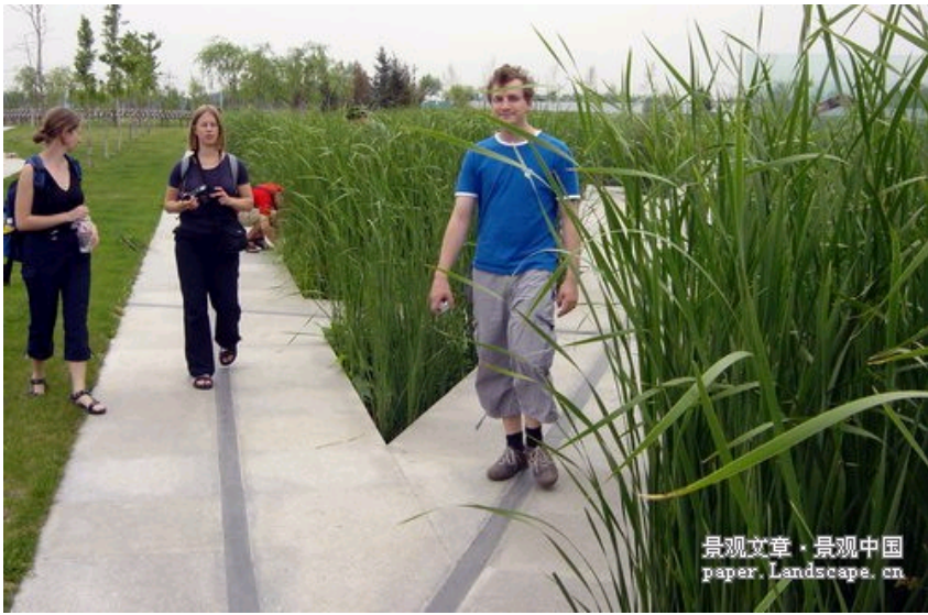
图-5, 6, 7, 8

Access is provided by paths on different levels in the Zhongguancun Life Science Park in Peking, a system of water and wetlands.