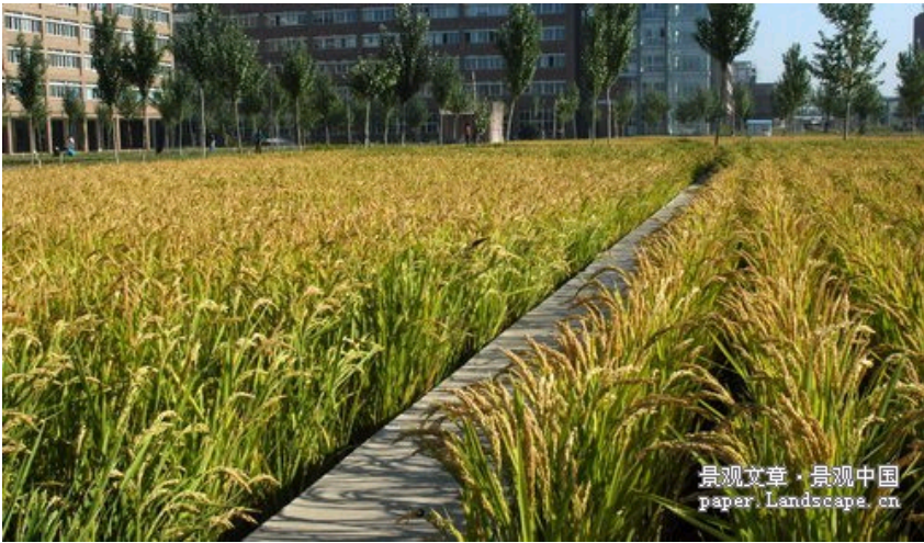
图-3,4 The landscape architecture office Turenscape integrates features of cultural landscape into its projects. Paths and rows of trees divide the grounds of the university campus in Shenyang into parcels where rice is cultivated.

土人景观将文化景观元素结合到项目中，步行道和成排的树将校园分割成块，里面种植水稻。