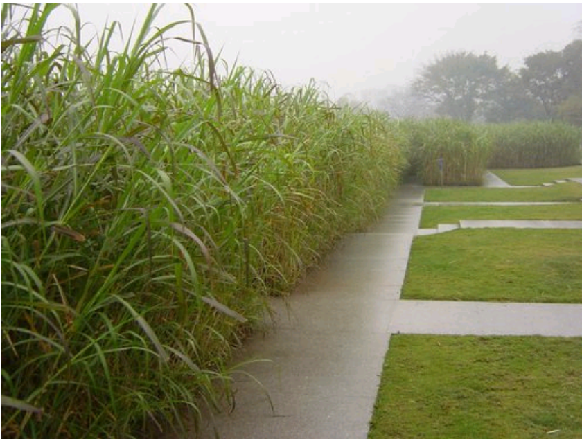
图6 广东中山岐江公园：乡土野草的种植设计，源于当地甘蔗地的体验（该设计获2002年全美景观设计荣誉