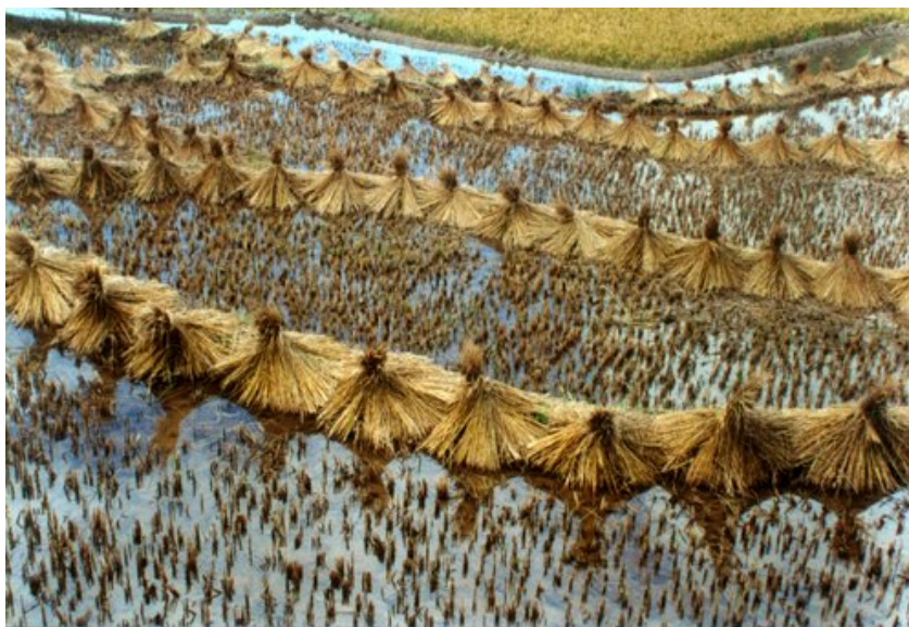
图2，3：乡土景观之美和意韵在于它的功用性，是内在者与周围环境相互调和、相互适应过程的体现：云南哈尼梯田。

b. 具有自发性。使用者和创造者的结合使景观创造的行为随时可以发生，不受其他因素的约束，只要正在进