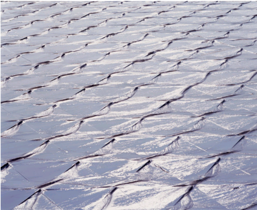
图4-5：“鱼嘴的灵感”：都江堰广场中心水景设计，其灵感来源于当地千百年来用鱼嘴来分水并灌溉整个成都平原的乡土景观和水利技术（该设计获2004年Architectural Review Ar+d recommended, 土人景观设计）