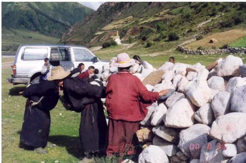
图1: 玛尼堆的形成: 内在人的参与是乡土景观形成的必要条件

b. 使用者和创造者统一:一种文化景观是由人创造的,其目的就是为人所用,尽管这种使用的范围比较广泛,包括观看、实际使用及其他等。乡土景观的使用者和创造者必须是统一的,或者说使用者必须主持和部分参与景观的建造过程。以城市住宅和乡村住房为例,城市住宅大多是规划设计人员和工程人员的工作结果,只有在建成之后居民才会搬进来居住、生活,因而不属于乡土的范畴;而乡村的住房多由居住者自己准备材料、选地基、并确定和安排整个建造过程,虽然靠一家人的力量无法完成建设工作,邻里乡民的帮忙也是以居住者的意志为主,随时听其安排。