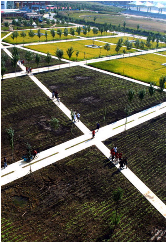
图7 沈阳建筑大学：大面积的水稻种植作为一个全新校园景观的一大特色，其设计灵感源自东北稻的种植景观，它不但在很短时间内起到校园绿化的目的，而且造价和维护成本很低，并能盛产作为大学纪念品的“建院金米”（该设计获2005年全美景观设计荣誉奖，土人景观设计，俞孔坚摄）。