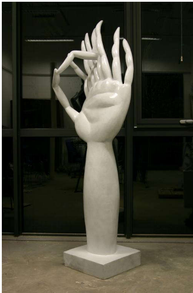
神算 100×50×180cm 树脂着色 2006年