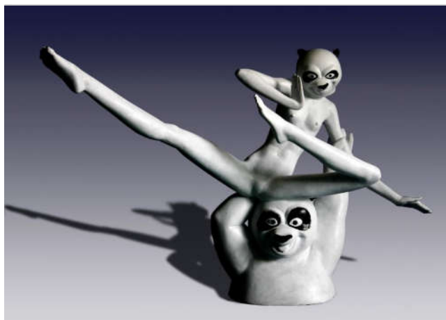
熊猫 80×40×50cm 树脂着色 2010年