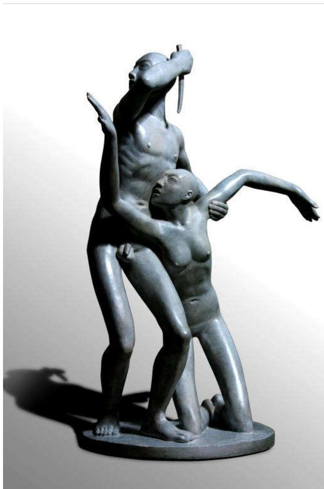
事件 50×40×80cm 铜 2010年