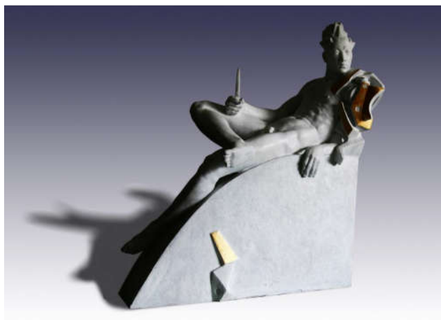
变形记1号 80×35×70cm 树脂着色 2010年