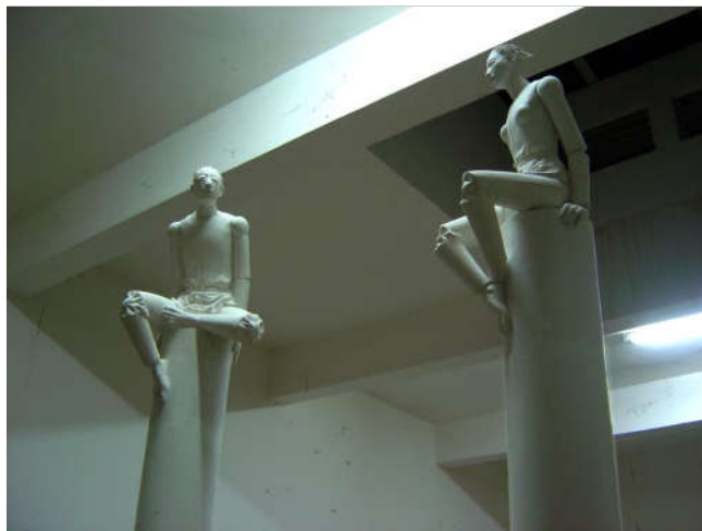
孤独 50×50×220cm 树脂着色 2007年