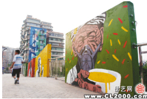
“父亲”戴上防毒面具

在涂鸦街的许多地方，都预留了空白墙，这些墙面将提供给市民，涂鸦街6月上旬开街后，市民可亲自上阵进行创作。