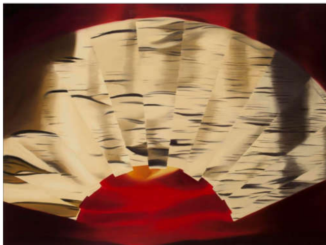
春夏秋冬—秋 150×200cm 布面油彩 2012年