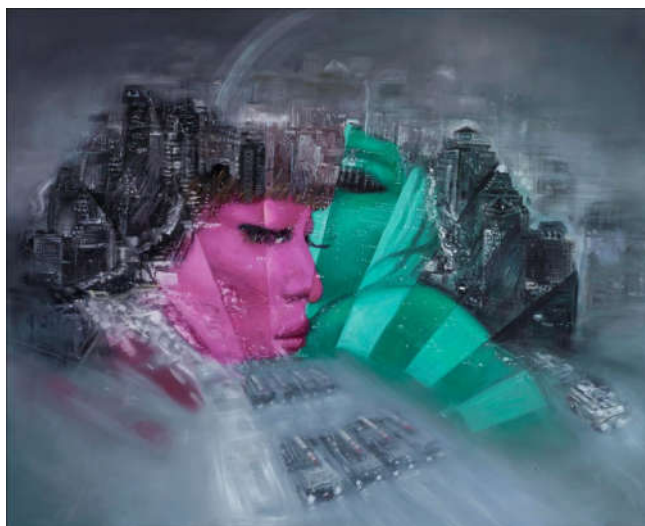
城市碎片之三 180×220cm 布面油彩 2015年