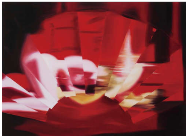
春夏秋冬—夏 150×200cm 布面油彩 2012年