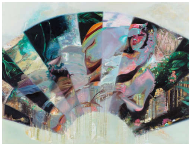
新伊甸园之三 130×170cm 布面油彩 2015年