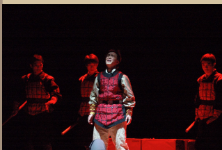
浙江大学黑白剧社2 ..