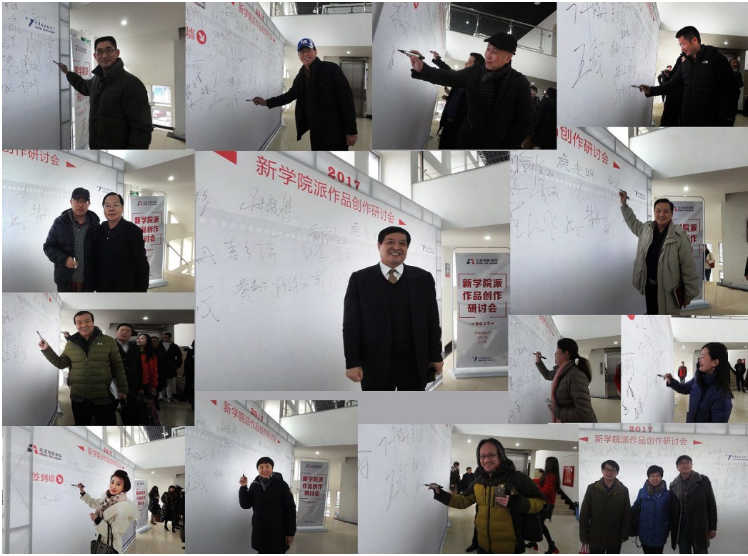
部分出席领导及老师签到

以侯光明书记的话来作为结束语，是对本次研讨会的一个最好的总结。2017年中国电影掀开了崭新的一页，国家已经明确了“稳健增长不是目标，长足进步才是目的”的发展方向，要实现从电影大国向电影强国的历史性转变，中国电影仍有巨大的艺术进步空间和产业发展潜力。2017年，北京电影学院将以“拍大片”为重点工作，高举“新学院派”电影旗帜，不断深化青影改革，破除各项困难，开拓发展路径，与广大师生校友和社会各界力量一起，拍摄具有时代精神的“新学院派”文化大片，为中国电影的繁荣和发展做出新的贡献。