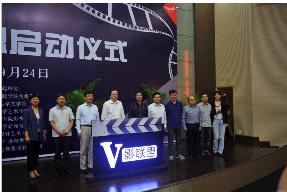
“微影联盟”启动仪式现场

中国社会科学网江苏讯（记者吴楠 王广禄 通讯员黄晓丽）9月24日，由南京大学金陵学院传媒学院、南京大学文学院、东南大学艺术学院、南京艺术学院影视学院、南京师范大学新闻传播学院、南京理工大学设计艺术与传媒学院、南广学院广播电视学院和江苏广播电视集团教育频道发起的“微影联盟”启动仪式在南京大学金陵学院举行。由此，江苏首个由高校与媒体联合创建的微电影创作平台在南京成立。