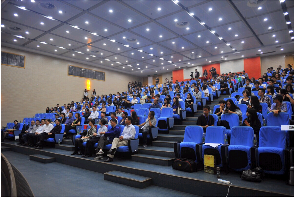
“微影联盟”启动仪式现场。

在全面深化改革的背景下，传媒市场的变革势如破竹，对传媒教育和传媒产业等也提出了新的挑战，在行业探索的同时，相关高校对人才培养机制和打造产学研平台不断展开新的探索。据介绍，“微影联盟”的成立旨在打破新闻传媒教育的校际障碍、专业壁垒和业学两界的隔膜，实现高校、市场的微电影人才资源共享与优化，为打造产学研平台提供一个全新的思路。