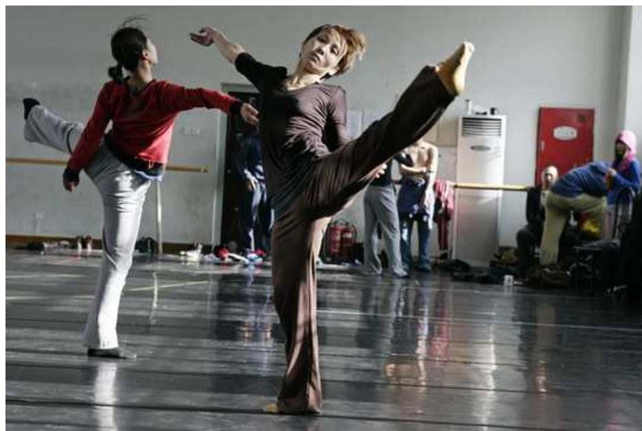
由香港城市当代舞蹈团主办，北京雷动天下现代舞团协办的《香港-北京舞蹈平台2010》，将于2