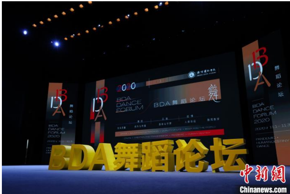
开幕式现场

中新网北京11月2日电 (记者 应妮)BDA舞蹈论坛(2020)1日在北京舞蹈学院开幕。论坛由北京舞蹈学院和中国舞蹈家协会联合举办，从1日到3日通过线上、线下相结合的方式，以“疫情人类命运舞蹈”为主题，汇集国内外舞蹈艺术家和关注舞蹈艺术的各界专家学者，共同探讨舞蹈艺术与舞蹈教育对生命、人类社会发展的价值和意义。