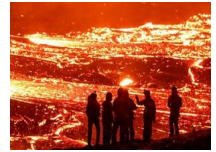
民众围观冰岛火山