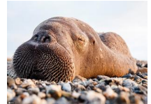
晒晒动物们的睡姿萌照