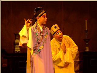
古老的昆剧又过节 ..