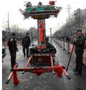
卸装后的太谷铁棍

第三，抬阁者。一副铁棍需8人抬，1人压杠，1人指挥。个头要匀称，会走舞步，行动时脚尖先着地，一步一颤动，步伐一致，能使台阁随着舞步上下颤动。小演员随之摆动水袖，优美壮观。