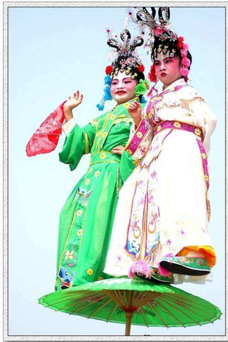
NIKON D50 F4.5/2000s

近日（2006.10.5——引者），由中国文联、中国民协、广东省文联、广州市文联、广州市番禺区委区政府联合主办的“第八届中国民间文艺山花奖·中国首届民间飘色(抬阁)艺术展演”在番禺举行。……此次展演活动共有来自浙江、江西、广西、青海、甘肃、广东等16个省、市、自治区和澳门特别行政区的28支代表队、800多人参加。展演汇聚了大江南北风格各异的飘色(抬阁)艺术。飘色(抬阁)以故事传说为主要内容，巧妙运用力学原理，融美术、装饰、杂技于一体，设计精巧，色彩艳丽，具有鲜明的地域风格和艺术特色，充分展示了我国民间艺术的风姿与成就。展演期间还举行了盛大的巡游活动。通过展示和评比，四川江油市高抬戏表演艺术团、广东省广州番禺区化龙潭飘色队、山西省民间抬阁艺术团等10个队伍和广东省吴川市民间飘色艺术团、青海湟中县拦隆口镇千户营飘色表演队等18个队伍展演的节目分别荣获第八届中国民间文艺山花奖暨中国首届民间飘色(抬阁)艺术展演优秀入围奖和入围奖。[41]