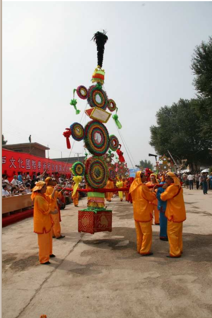
山西潞城市贾村2006年皇杠表演

还有一类台阁不以真人扮演，而以竹、木、纸、纺织品等物质材料制作成各类戏剧、故事人物或吉祥图案，仍由2人、4人或8人抬扛，巡游表演。乾隆中期进士李声振在《百戏竹枝词》中介绍了北京一种名“台歌”的艺术：“作台阁状，中设机械，扮十馀岁童，为杂剧，数重，犹如掌上见舞者，甚可观。”[38]四川大巴山地区，迎神赛会时有“扎社火”的表演。其做法是在木制平台上竖一根支架，架上绑扎戏剧人物。人物用竹蔑绑扎骨架、彩色纸糊裱外装。4人抬着游走，配以鼓乐。[39]山西省长治、潞城一带迎神赛社时有“皇杠”表演。皇杠也叫“硬杠”，用木料仿制宝塔形状制成，横插有一定弹力的木杠以备抬扛。皇杠下部为方形木框，彩绘图案，内置重物以平衡。上部一般分三层，用彩绸、花朵、明镜、斗等装饰扎拼而成，同时书写“风调雨顺”、“封土立社”、“祈福报功”等，最上面要插鸡毛掸。硬杠在“圆神”时由数人抬扛[40]，上下颤动，以示狂欢。