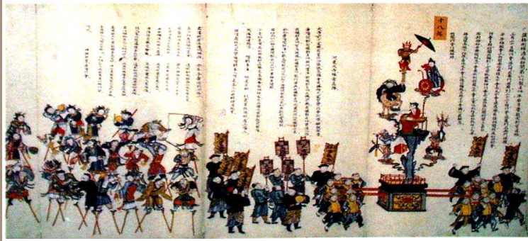
首都博物馆藏清代《天后宫过会图》局部

前清嘉庆间，津中盐商豪富，组织一抬阁会，参加皇会，斯会共计四抬，每抬以三十二人荷之。所抬者，为木制之阁，阁底计高八尺，底之上共有三抬，每抬占据一层，每层有童子数名演剧，行头则取法于梨园，作种种歌唱，及表演如《魍魉嫁妹》、《八仙庆寿》、《九老图》、《嫦娥奔月》、《麻姑献瑞》、《天女散花》、《白蛇传》等神话剧，兴办之始，费五千金。