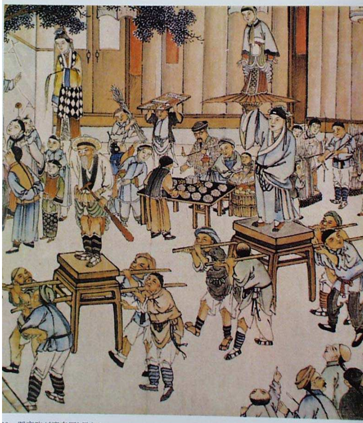
清光绪间四川绵竹年画《迎春图局部》

首先是自觉的概念意识，不少人对台阁这一古老的游艺项目用简洁明了的语言作解释。清乾嘉时常州人洪亮吉在《里中十二月词》中自注曰：“里中赛神以清明、中元、下元三节。届期城隍神皆诣北坛行礼，出入仪从甚盛，皆设云车、台阁、故事。倾城士女咸设幕观焉。”《南楼忆旧诗四十首之三十一》：“才过中元又下元，赛神箫鼓巷头喧。来年台阁多新样，都插宫花扮杏园。”注：“赛神会中每用七八人扛一桌，上扮金元院本诸故事，名曰‘台阁’。”[25]清末福州诗人也对台阁进行了简洁说明：“以木板为台，上布剧景，以善唱者分坐其中，旁夹笙箫和之，四人史前后，谓之台阁。”[26]