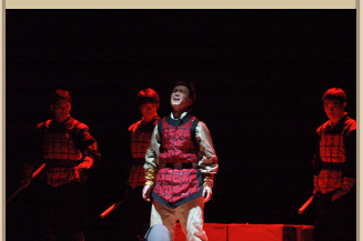
浙江大学黑白剧社2...