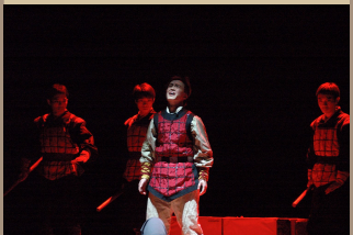
浙江大学黑白剧社2 ..