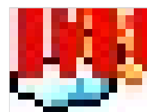
高考视障考生单招...