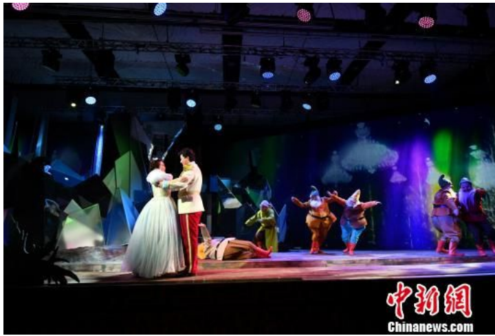
国家大剧院原创儿童歌剧《白雪公主》亮相。

《白雪公主》取材自格林兄弟同名经典童话，在这则家喻户晓的童话故事里，白雪公主、王子、七个小矮人等形象伴随着一代代观众的童年时光，善良战胜邪恶、勇敢击退懦弱的剧情早已深入人心。