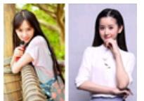
盘点大学绝美校花