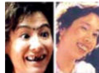
女星扮丑谁最吓人