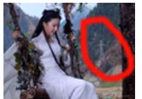
影视搞笑穿帮镜头